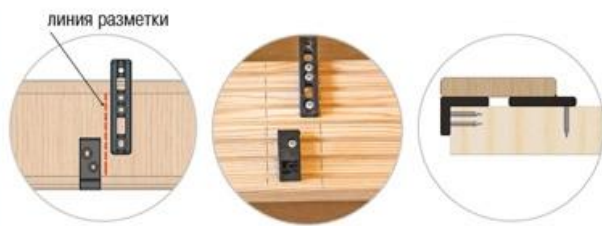
Вариант 1 – ТОРЦЕВОЕ крепление стартового крепежа

3 Монтаж первой доски. Выбираем наиболее удобный вариант крепления (торцевой или боковой) первой доски. Крепим шурупами №1 на первую доску стартовый ДУЭТ и один элемент крепежа ДУЭТ 90. Через монтажные отверстия стартового ДУЭТа и ДУЭТа 90 шурупами №2 крепим первую доску к лагам террасы.