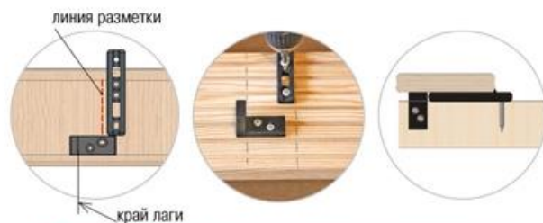
Вариант 2 – БОКОВОЕ крепление стартового крепежа

4 Монтаж рядовых досок на лаги. Устанавливаем палубную доску с закрепленным крепежом ДУЭТ 90 на основание террасы. Для формирования монтажных зазоров используем сборку А-спейсеров. Через монтажные отверстия крепежа крепим палубную доску к лагам шурупами №2. Крепим необходимое количество палубных досок. А-спейсеры перемещаем только после крепления 3-4-х рядов. Свободный край последней доски фиксируем наиболее удобным способом.